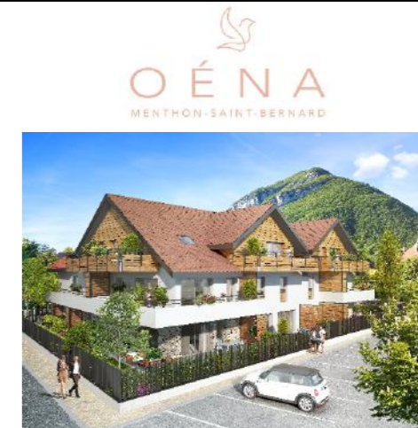
Clos des Revioux - 74290 MENTHON SAINT BERNARD