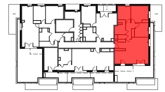
Bâtiment B - R+2