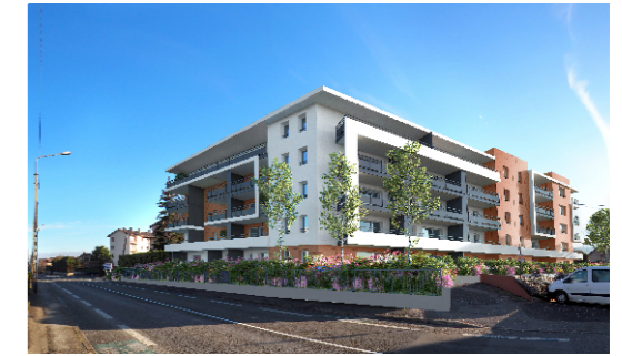
Avenue du Clos Banderet - 74200 THONON LES BAINS