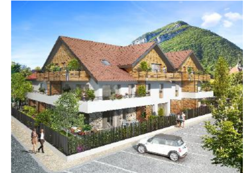
Clos des Revioux - 74290 MENTHON SAINT BERNARD