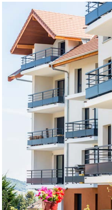
RÉSIDENCE ALTÉO Bons-en-Chablais