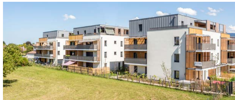
RÉSIDENCE ENTRE DEUX Veigy-Foncenex