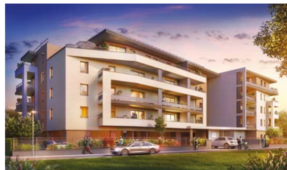
RÉSIDENCE TERREO Thonon-les-Bains