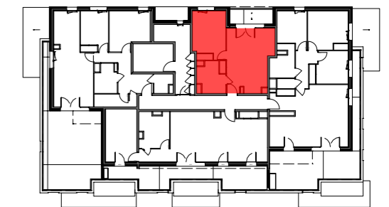
Bâtiment B - R+2