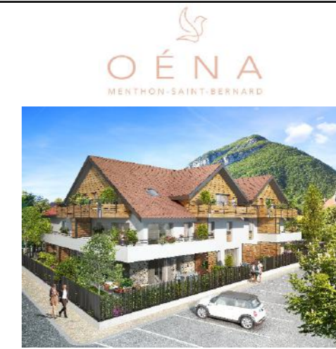
Clos des Revieux - 74290 MENTHON SAINT BERNARD