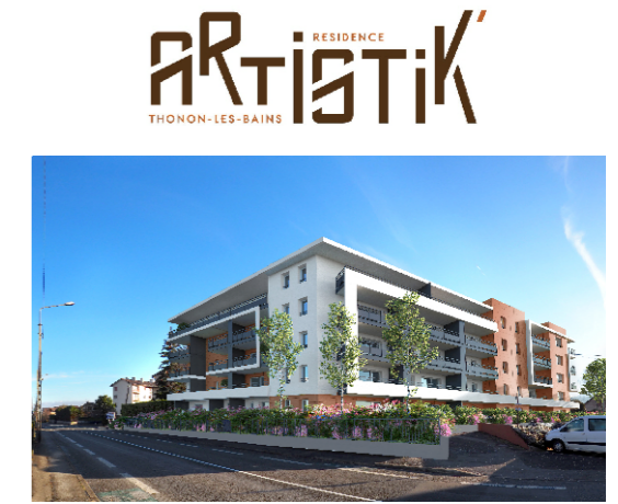
Avenue du Clos Banderet - 74200 THONON LES BAINS