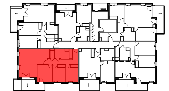
Bâtiment A - R+1