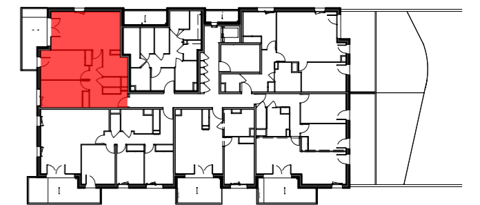
Bâtiment A - RDC bas