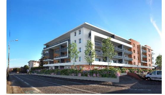
Avenue du Clos Banderet - 74200 THONON LES BAINS