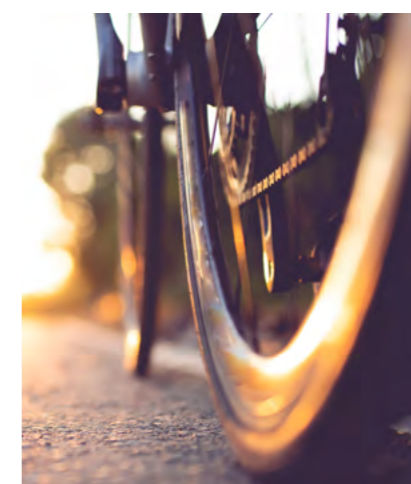
LOCAL À VÉLOS INTÉRIEUR ET ARCEAUX EXTÉRIEURS