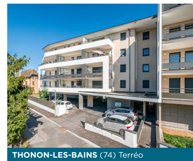
THONON-LES-BAINS (74) Terréo

L'ADN d'Imaprim s'est construit autour d'un écosystème fondé sur 3 valeurs fondamentales :