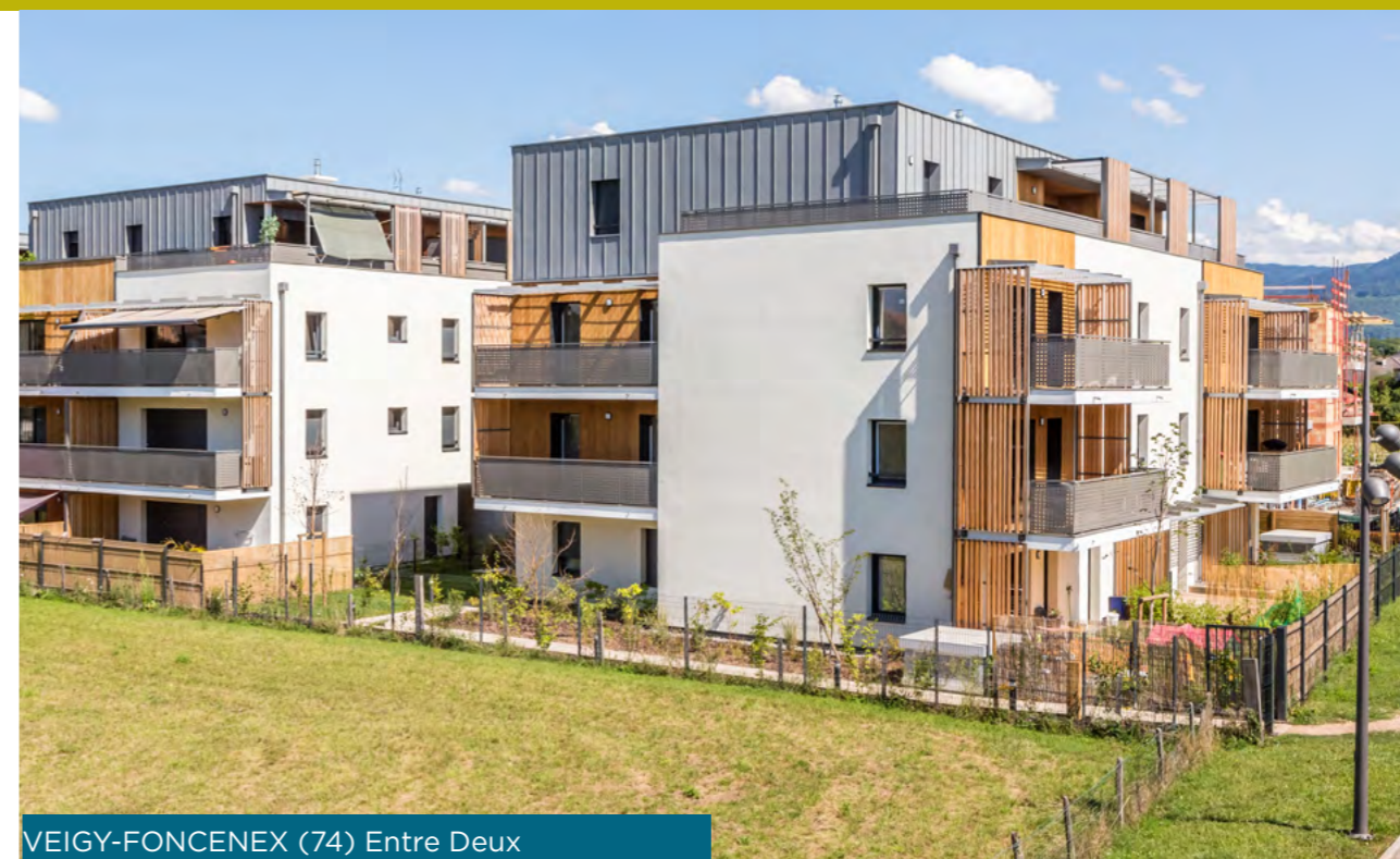
VEIGY-FONCENEX (74) Entre Deux

Nous œuvrons pour la préservation de l'environnement, en faveur d'un habitat plus durable, en intégrant les exigences de la biodiversité, la gestion de l'eau et de l'énergie, de la mobilité durable, de la qualité de vie ou encore du recyclage.