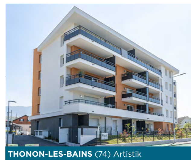
THONON-LES-BAINS (74) Artistik