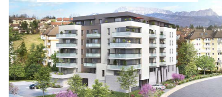
rue Jacqueline Auriol à ANNECY