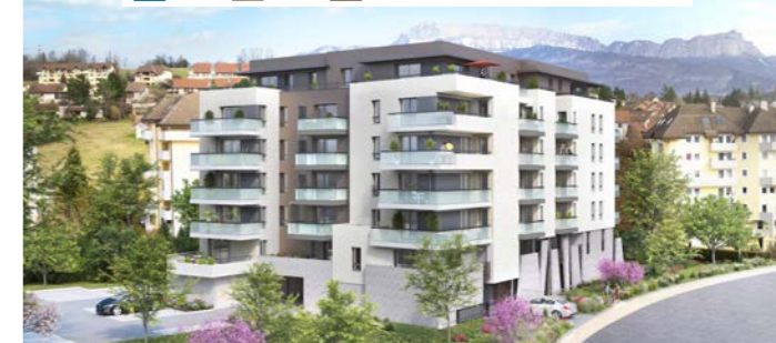
rue Jacqueline Auriol à ANNECY