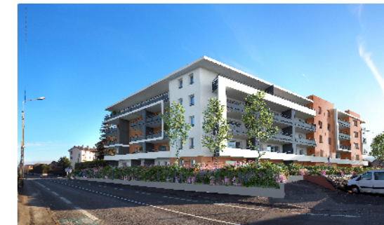
Avenue du Clos Banderet - 74200 THONON LES BAINS